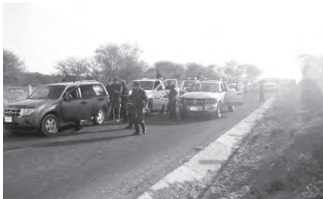
Operativo realizado en el municipio de Zapotlán