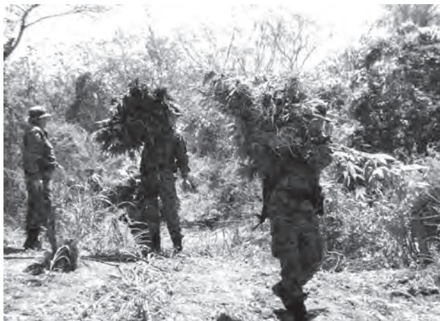
Dstrucción de plantío de marihuana por la policía estatal en Tequila, Jalisco