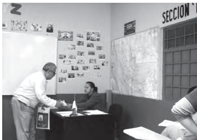
Internos de cursos de nivel básica en los centros del complejo penitenciario de Puente Grande