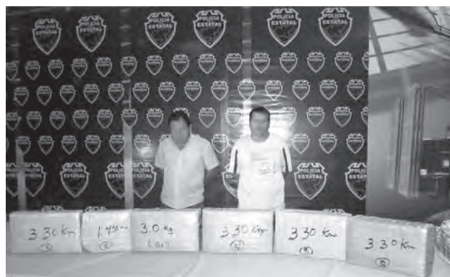
Aseguramiento de marihuana en el municipio de Tlajomulco de Zúñiga