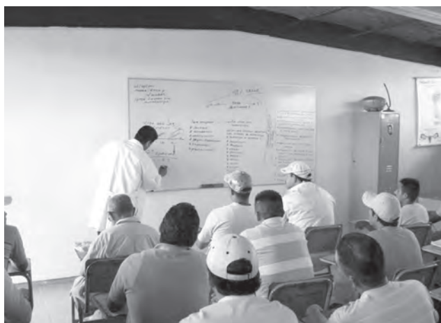
Taller de psicología, modulo, ética y valores para internos de Puente Grande