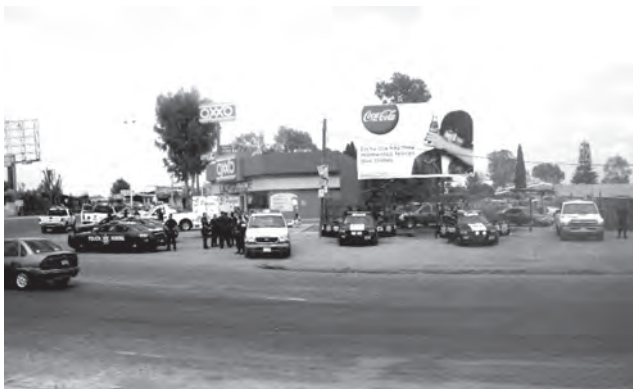
Operativo realizado en el municipio de Tepatlán