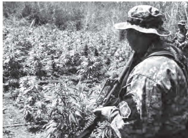
Localización de plantío de marihuana por elementos de la policía estatal