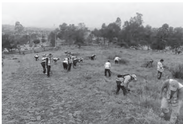
Limpieza y corte de maleza del Panteón Jardín Guadalajara