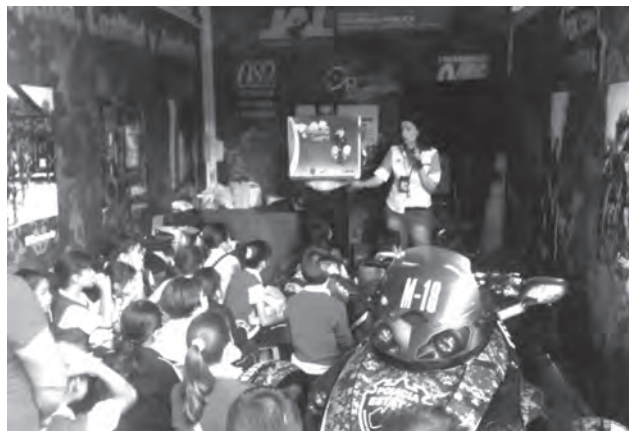
Sesión Aprendiendo a Cuidarte, en stand de las Fiestas de Octubre