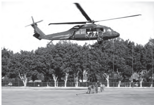
Curso operaciones helicoportadas, impartido a la policía estatal por la Policía Nacional de Colombia