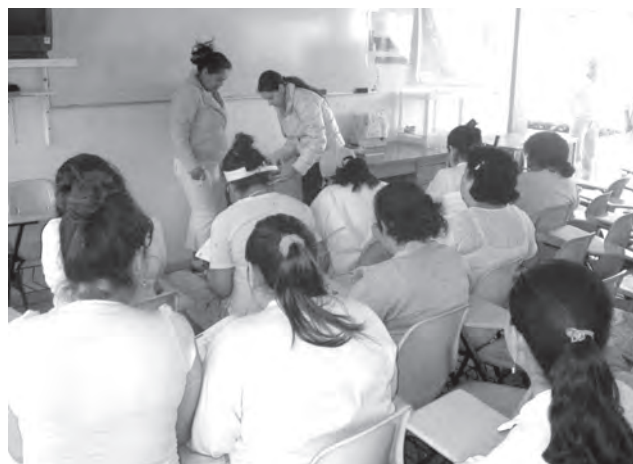
Internas cursando la educación básica en el Centro de Reinserción Femenil