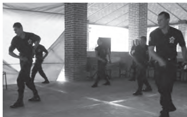
Capacitación realizada en el municipio de Sayula