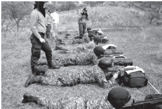
Curso comando de operaciones rurales, impartido a la policía estatal por la Policía Nacional de Colombia