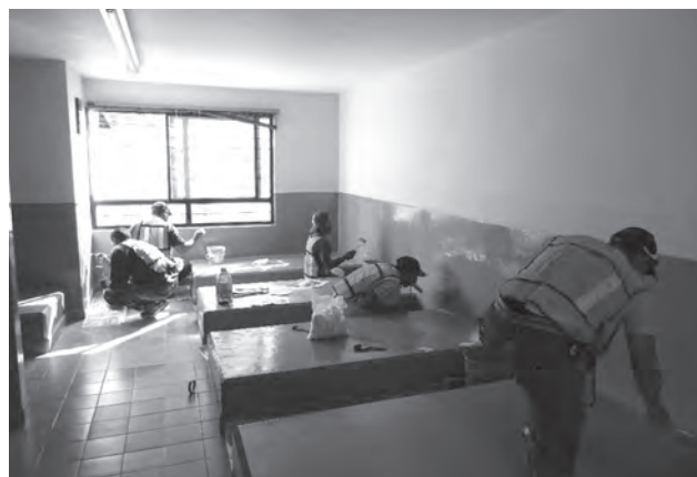
Pinta de habitaciones del albergue "La Luz" para hijos de internos