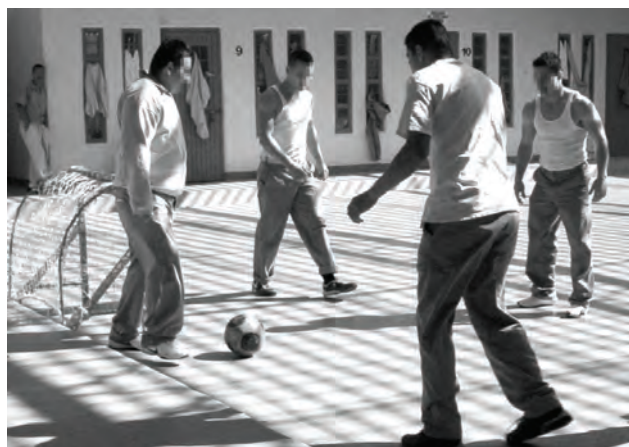
Internos en práctica de futbol en el complejo penitenciario de Puente Grande