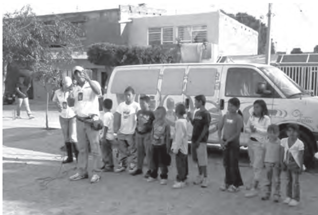
Gira preventiva en colonia de la ciudad de Guadalajara