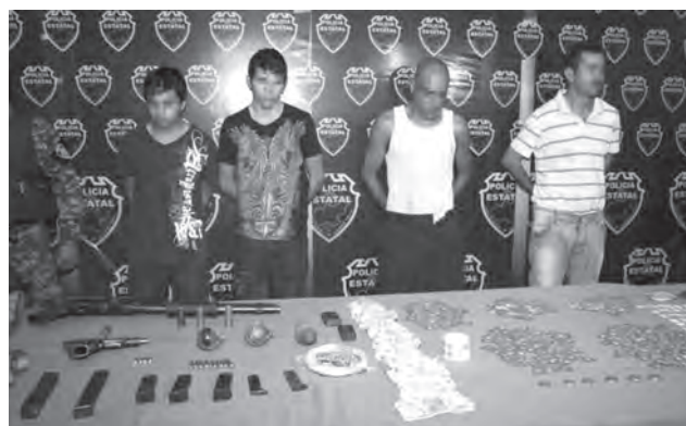
Detención de distribuidores de droga al menudeo, en el municipio de Tonalá