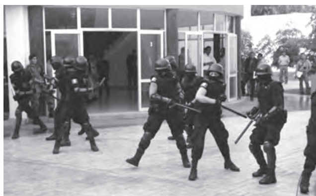
Capacitación realizada en el municipio de Gómez Farías