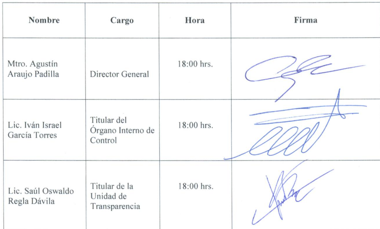
Tabla N. 1 – Lista de asistencia:

Nota: Los datos serán utilizados exclusivamente para el trámite que nos ocupa y serán archivados dentro de los expedientes del Comité de Transparencia.