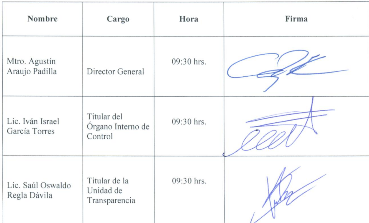
Tabla N. 1 – Lista de asistencia:

Nota: Los datos serán utilizados exclusivamente para el trámite que nos ocupa y serán archivados dentro de los expedientes del Comité de Transparencia.