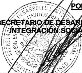
LIC. SALVADOR RIZO CASTELO

EL SECRETARIO DE DESARROLLO E INTEGRACIÓN SOCIAL