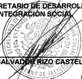
LIC. SALVADOR RIZO CASTELO

EL SECRETARIO DE DESARROLLO E INTEGRACION SOCIAL