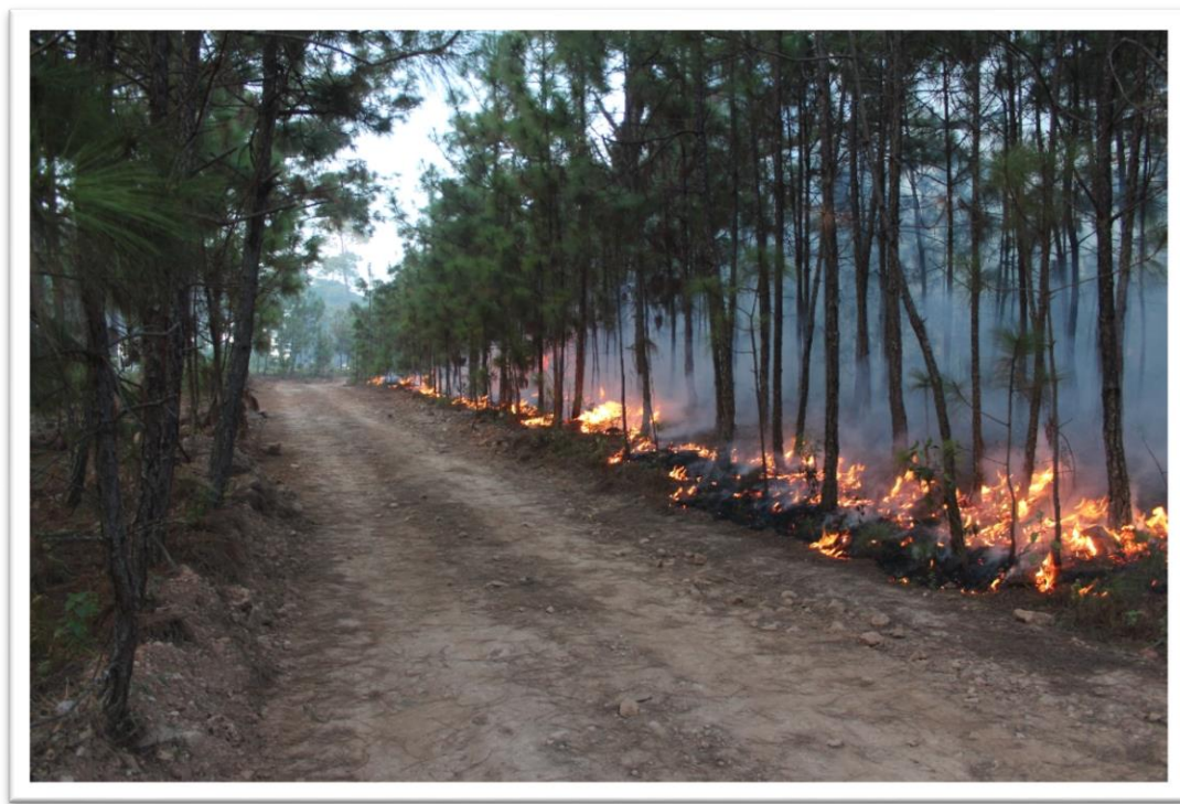
Ejido La Bautista. Quema Prescrita