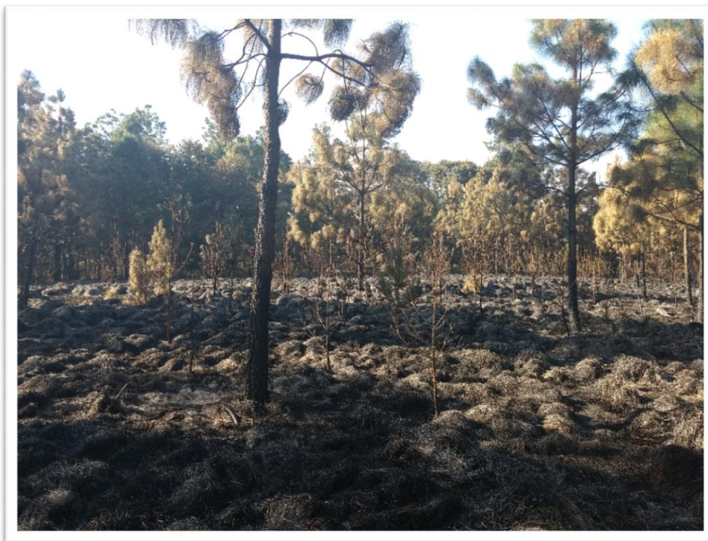
Resultados/Revisión de la Quema