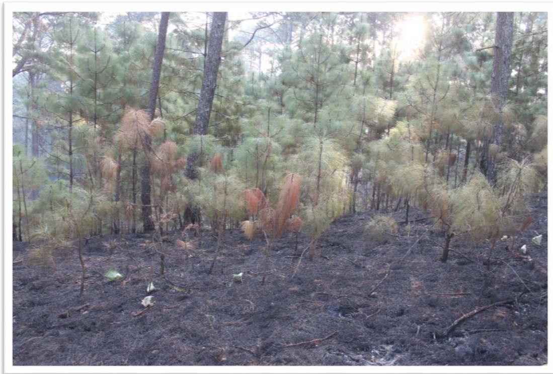
Ejido La Bautista. Resultados/Revisión de la Quema