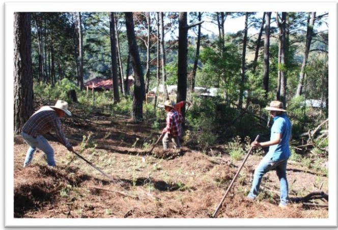
Ejido La Bautista. Preparando el Terreno para la Quema