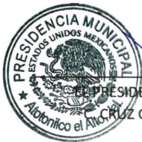
EL PRESIDENTE MUNICIPAL CRUZ CARRILLO SOLIS