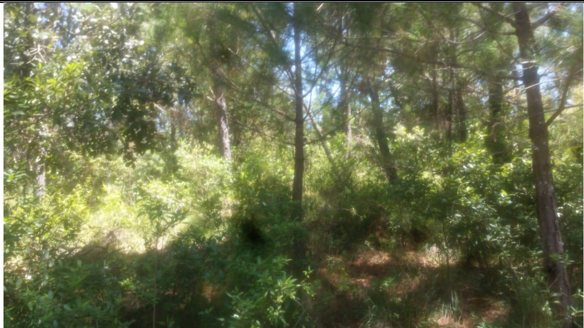
Fotografía 7. Arbolado joven.