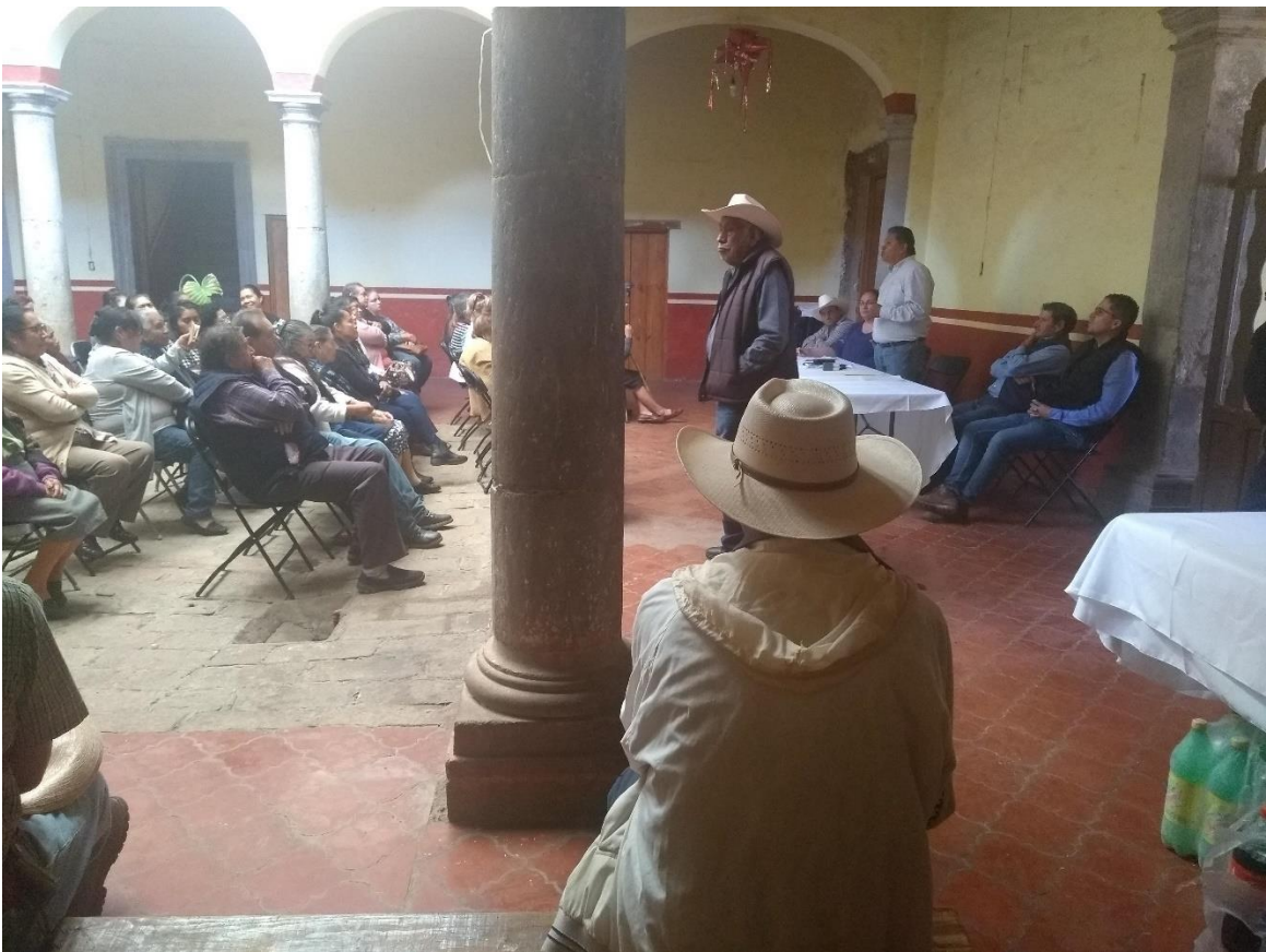
Fotografía 12. Asamblea de aprobación del ADVC.