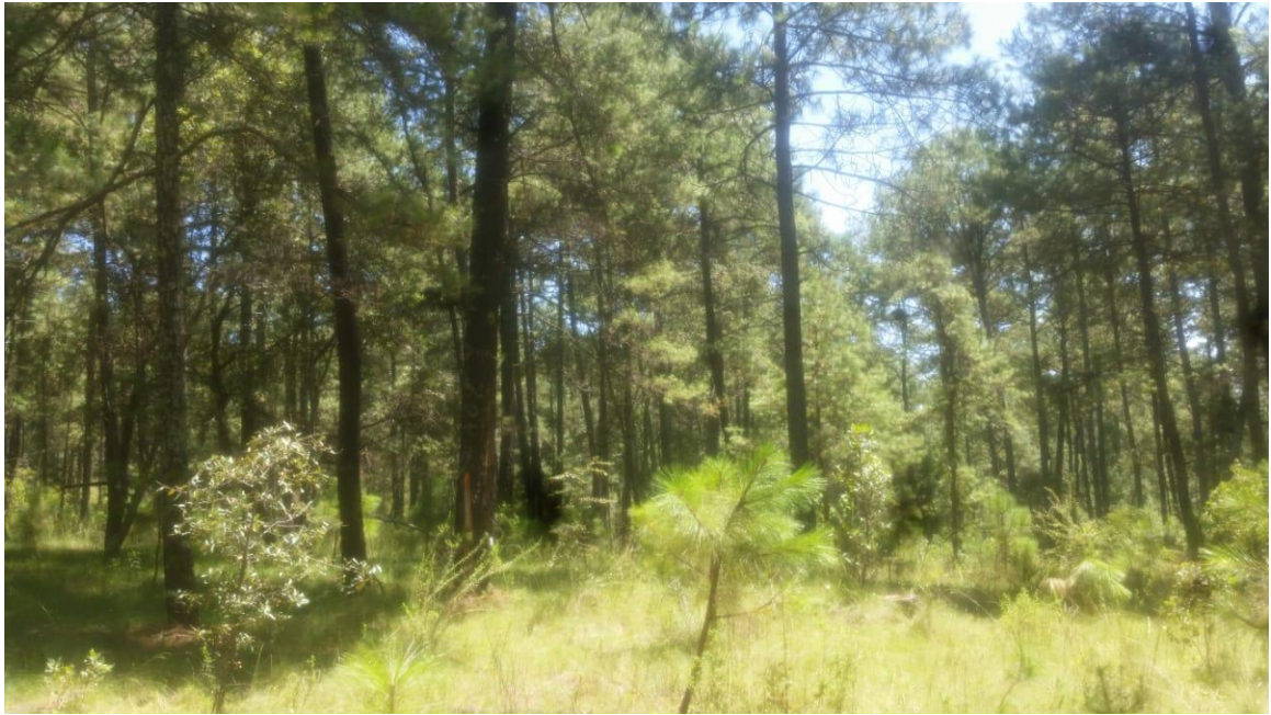
Fotografía 5. Regeneración natural.