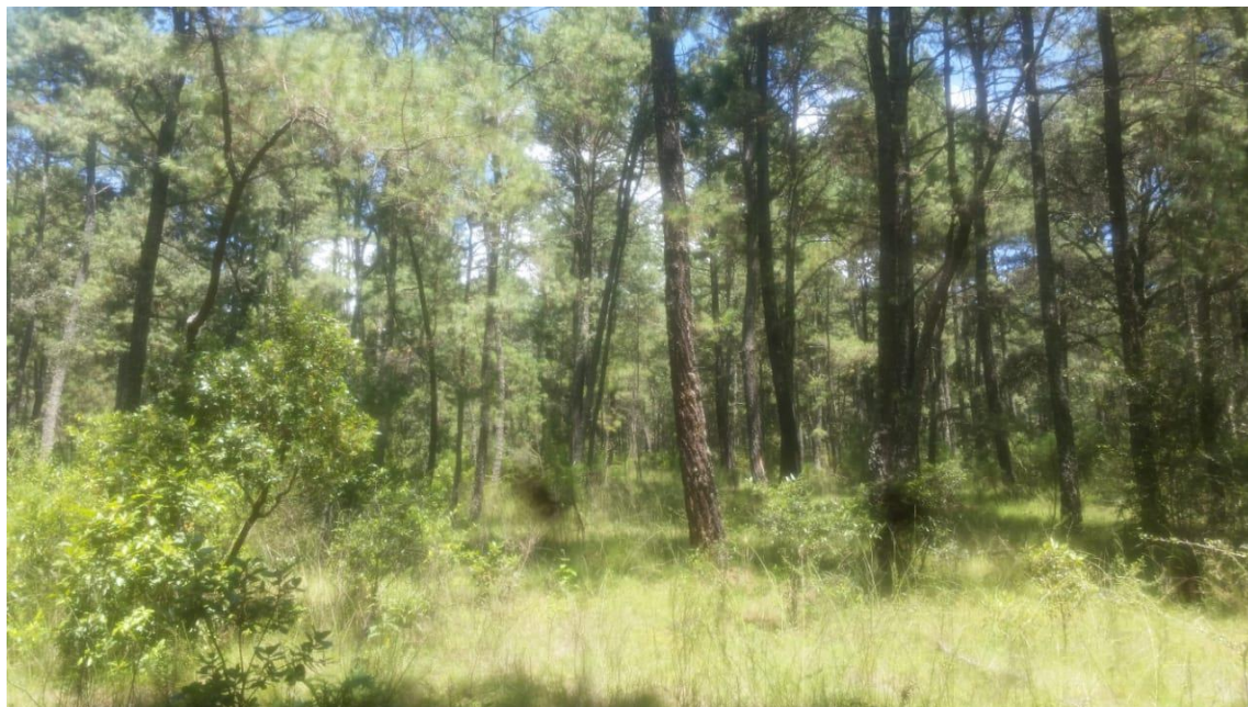
Fotografía 3. Claros en el bosque.