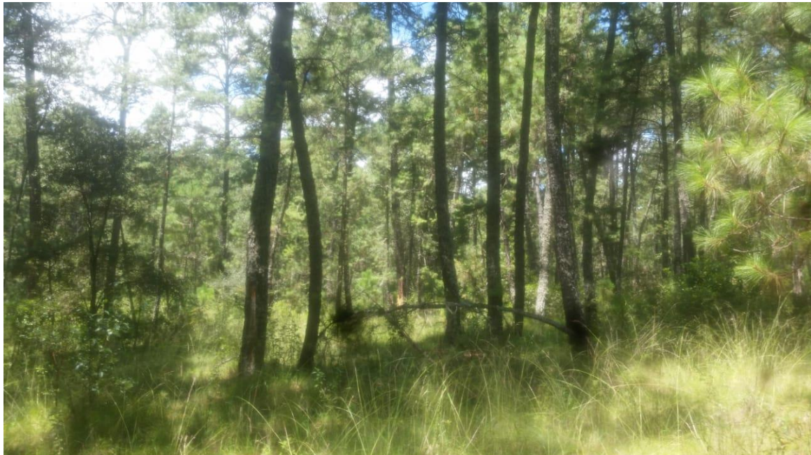
Fotografía 6. Pastos presentes en el área.