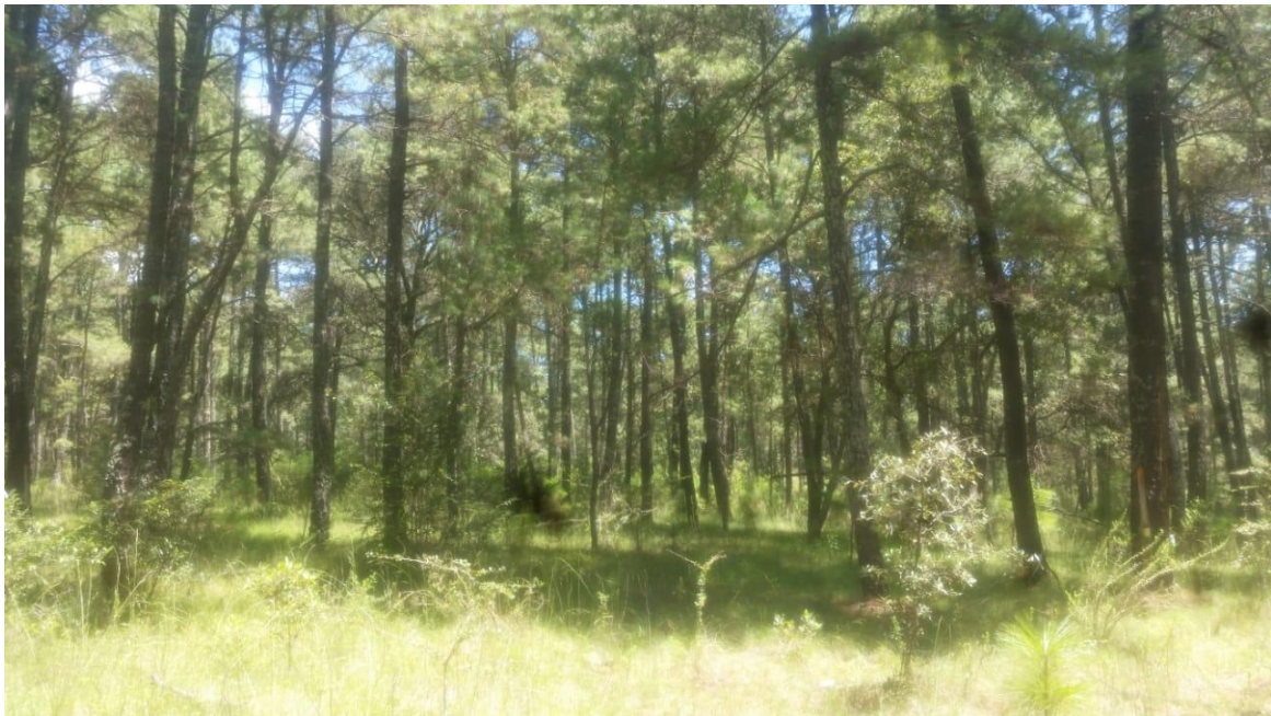
Fotografía 1. Cobertura arbórea de Pinus douglasiana .