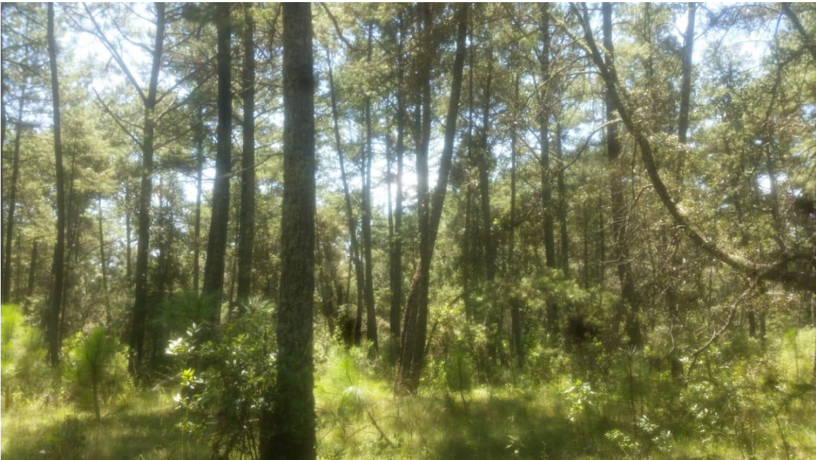
Fotografía 10. Regeneración natural.