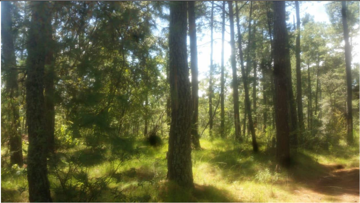
Fotografía 9. Arbolado adulto.