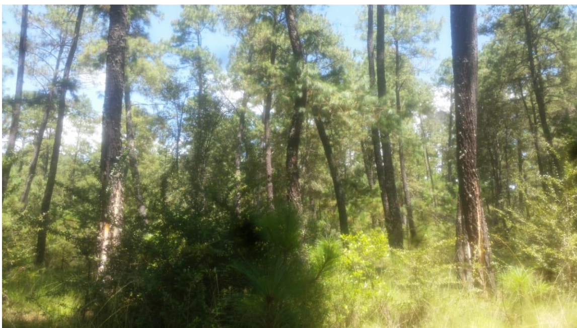
Fotografía 4. Especies arbustivas en el área.