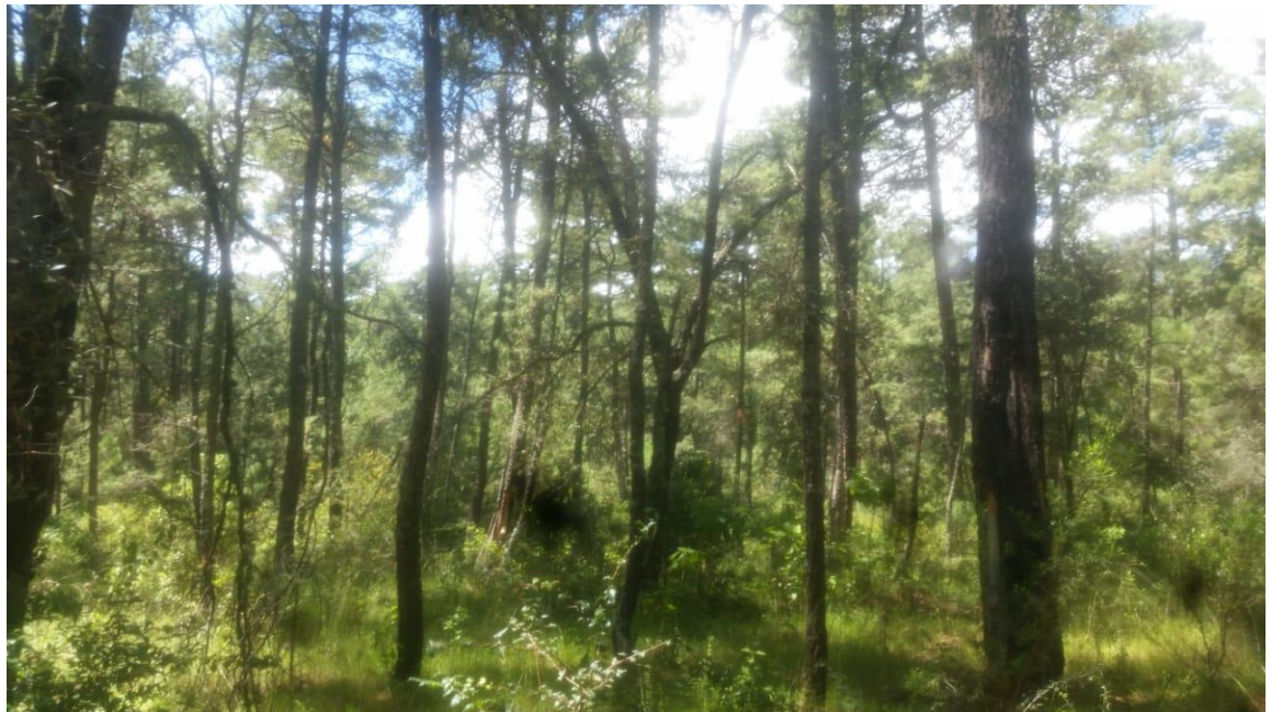
Fotografía 11. Área cerrada de pino.