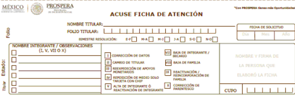
ANEXO VII a.- Reverso del Formato Ficha de Atención