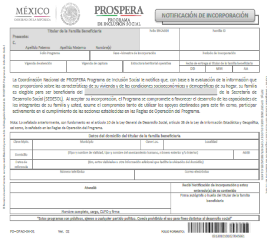
ANEXO VI.- Reverso del Formato Notificación de Incorporación