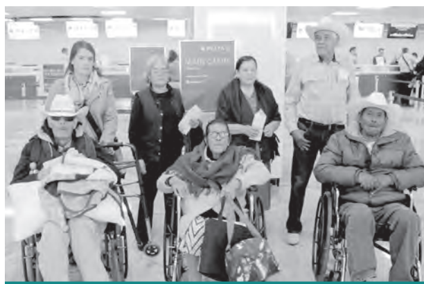
Tlajomulco de Zúñiga