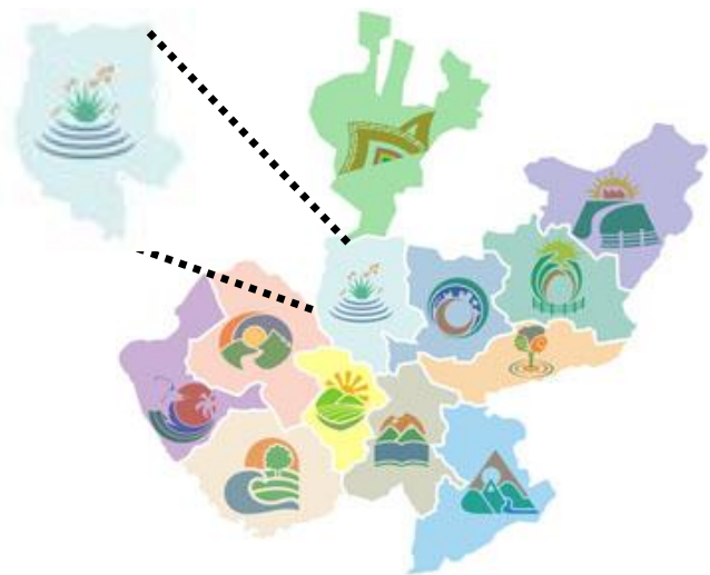
Figura 1.- Mapa regional del estado de Jalisco

Ahualulco de Mercado Amatitán Ameca San Juanito de Escobedo El Arenal Cocula Eztatlán Hostotipaquillo Magdalena San Marcos San Martín Hidalgo Tala Tequila Teuchitlán