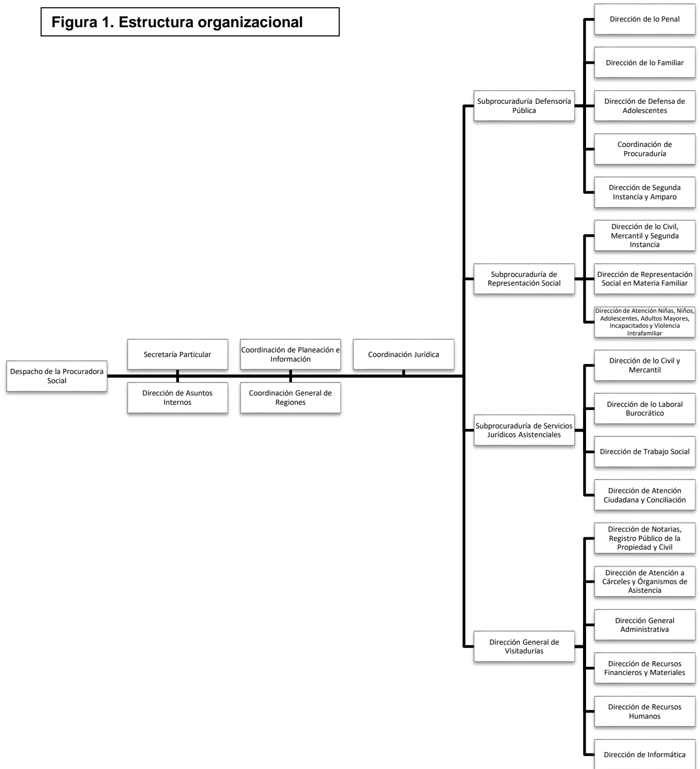
Figura 1. Estructura organizacional