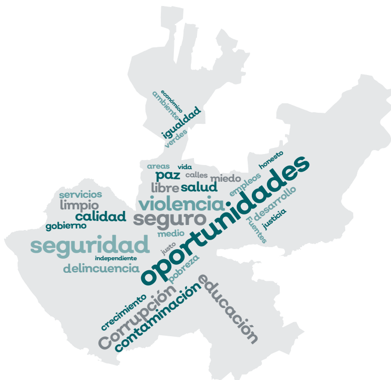
Figura 5.5. Palabras mayormente mencionadas que describen en el Jalisco en el que le gustaría vivir en un futuro