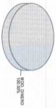
Distribución del Patrimonio