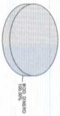
Distribución del Patrimonio