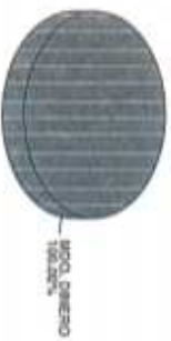
Distribución del Patrimonio