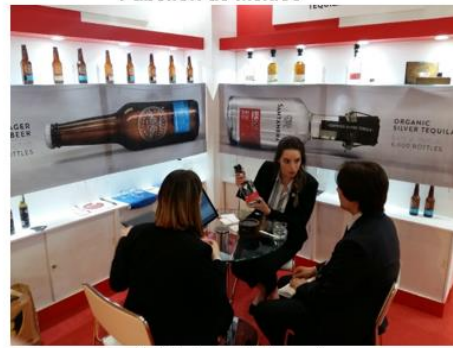
Japón (Makuhari Messe)