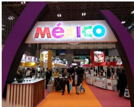
Japón (Makuhari Messe)