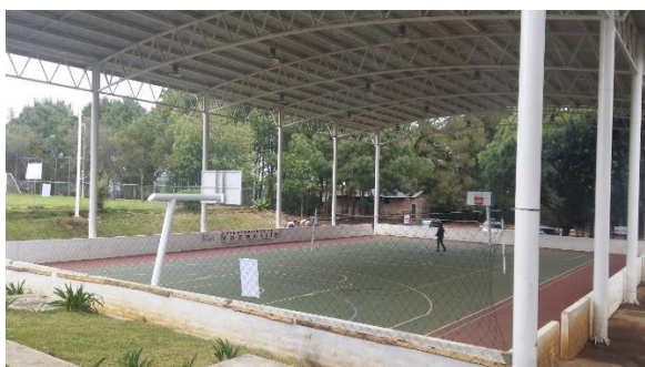
Figura 9. Unidad Deportiva Mazamitla