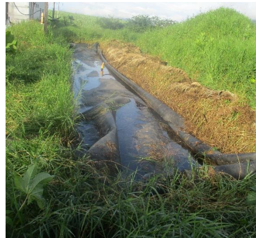
Figura 2. Rehabilitación biodigestor Tamazula