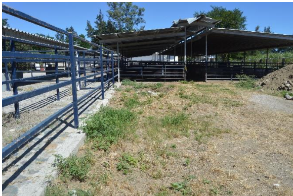
Figura 1. Rastro municipal de Zapotiltic