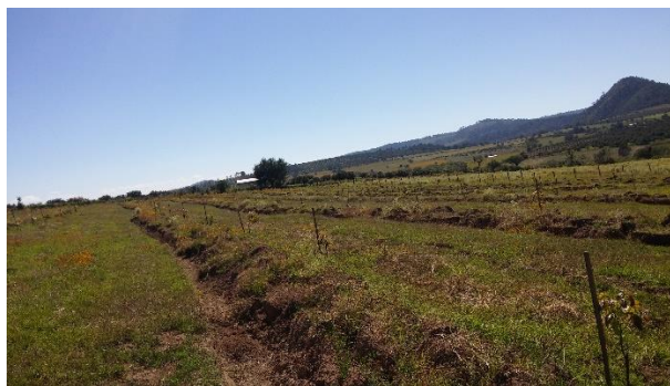
Figura 12. Zanjas de infiltración en Aguacate