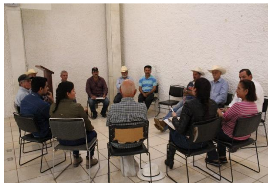
Figura 16. Diagnóstico para fortalecimiento de capacidades