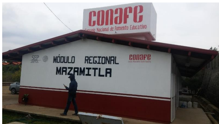
Figura 10. Instalaciones CONAFE Mazamitla