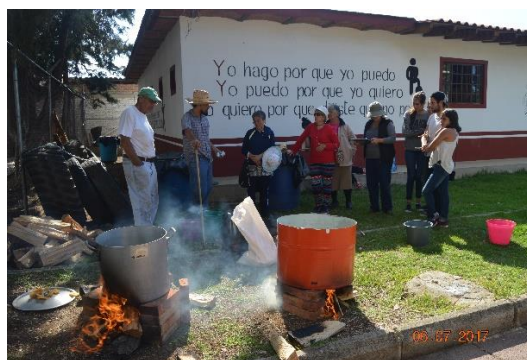
Figura 14. Elaboración de caldos orgánicos