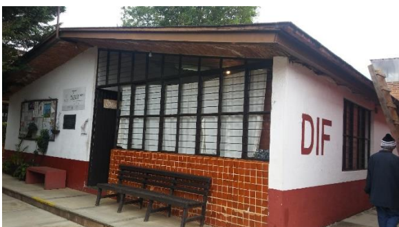
Figura 8. Oficinas DIF Mazamitla