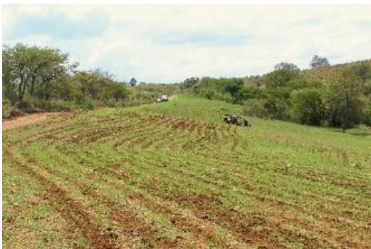
Figura 11. Trazo de curvas a nivel en Maíz