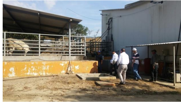
Figura 3. Reunión con representantes municipales Figura 4. Recorrido en rastros municipales