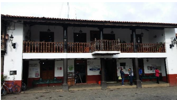
Figura 6. Presidencia municipal Mazamitla