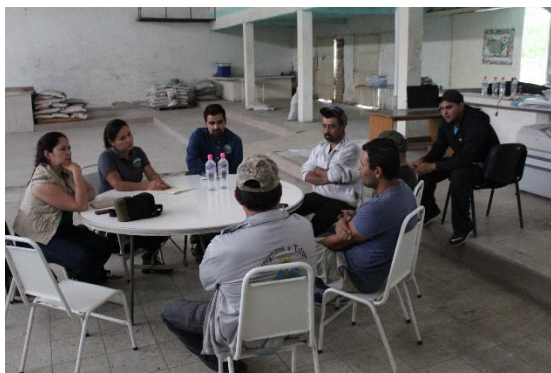
Figura 15. Reunión con productores