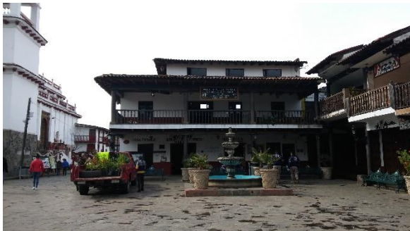
Figura 7. Biblioteca municipal Mazamitla