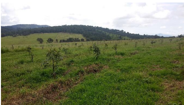
Figura 13. Curvas a nivel en Aguacate