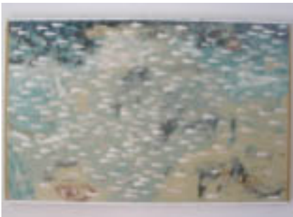
Joao Armando Rodríguez Murillo Panorama

Conjunto de 12 piezas en el que cada una aborda el tema de paisaje, además cada una coincide con la anterior y la siguiente pieza, creando así una visión global y/o panorámica de un paisaje