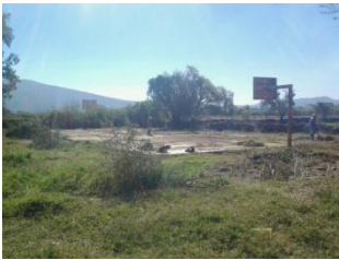
21_ DEPORTIVO DELEGACION DE MIRAFLORES