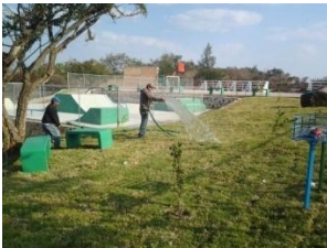
8_ PARQUE DEPORTIVO DE LA COFRADIA