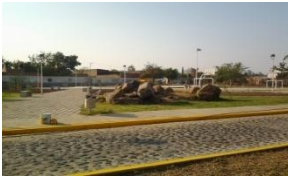
1_ PARQUE DEPORTIVO " VICENTE MICHEL "