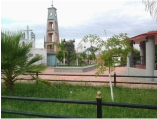
19_ PLAZA DELEGACION CASA DE TEJA