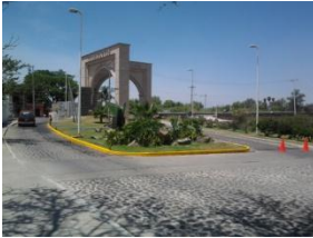
2_ AREAS VERDES DE LOS ARCOS