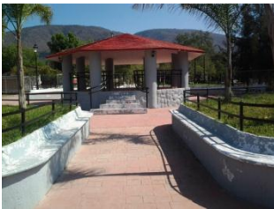
20_ PLAZA DELEGACION DE SAN ISIDRO