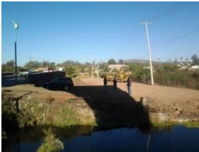
3_ AREAS VERDES DEL MIRADOR