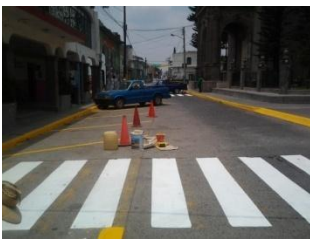
23_ MEJORAMIENTO URBANO