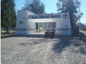
7_ UNIDAD DEPORTIVA BLAS SANCHEZ