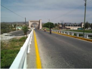
13_ PUENTE DE INGRESO