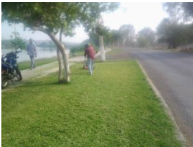
4_ AREAS VERDES DEL MALECON