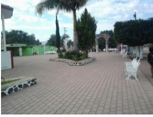
18_ PLAZA DELEGACION DE EX. HACIENDA