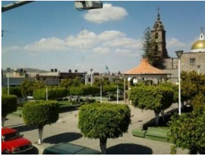
6_ PLAZA PRINCIPAL DE CABECERA MUNICIPAL