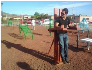
10_ PARQUE DEPORTIVO DE LA MESITA