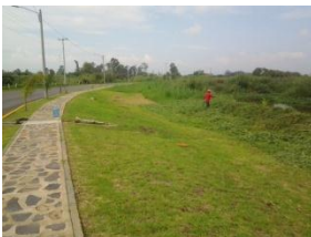
5_ AREAS VERDES DEL LIBRAMIENTO