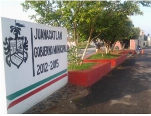
12_ JARDIN BARRIO PIRI