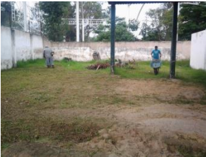
15_ AREAS VERDES DE CASA DE LA CULTURA