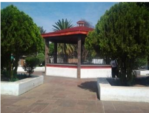
16_ PLAZA DELEGACION DE SAN ANTONIO