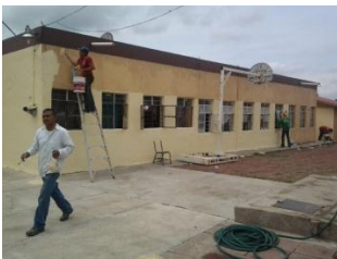
24_ APOYO A ESCUELAS, INSTITUCIONES Y OTRAS AREAS