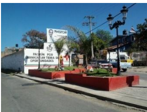
11_ JARDIN LOS CARRILLO