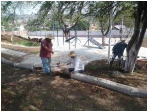
9_ PARQUE DEPORTIVO GERONIMO MENDEZ