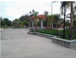
17_ PLAZA DELEGACION DE RANCHO NUEVO