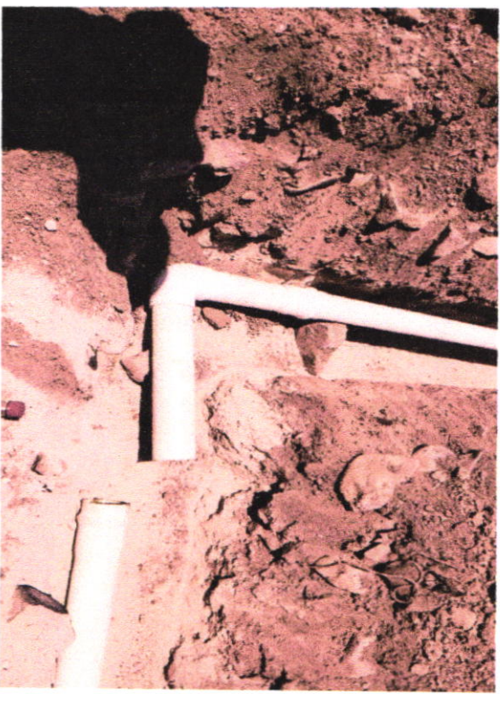
Electrificación y equipamiento de pozo profundo de agua potable, ubicado en la presa seca en la Comunidad de Camichines