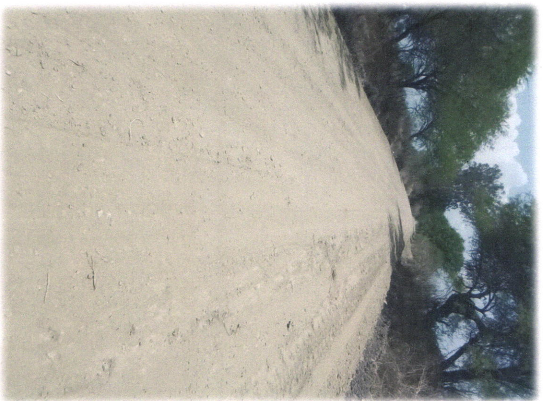
REHABILITACION DE CAMINO PUERTA DEL BORREGO A LA SAUCEDA