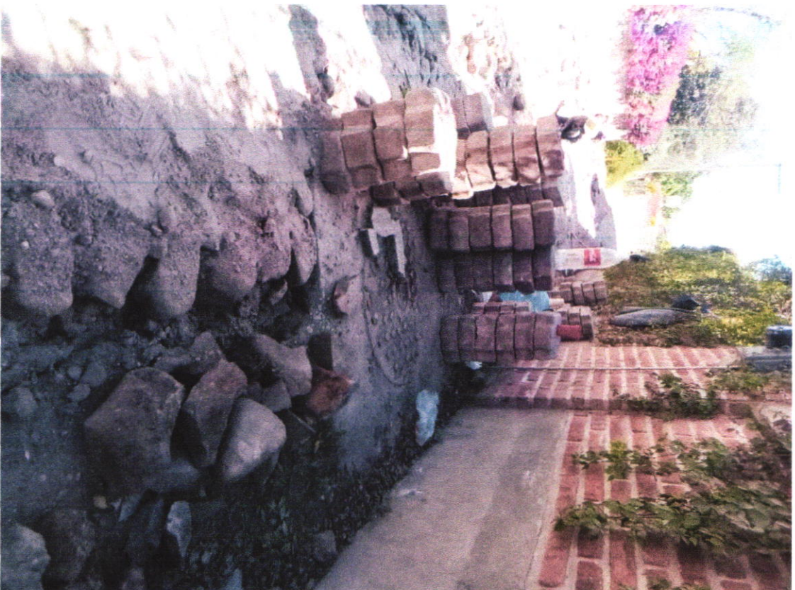
Reparación del adoquín de la calle Andador Cardenal