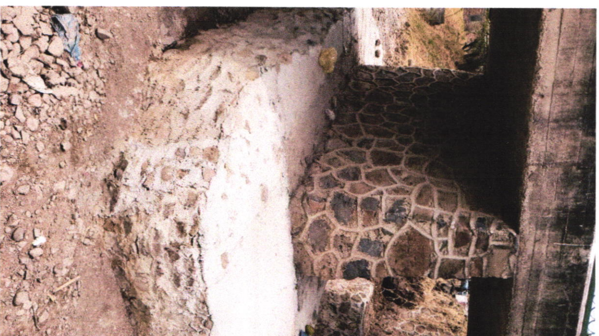
Reparación y mantenimiento área del Puente Román Terán