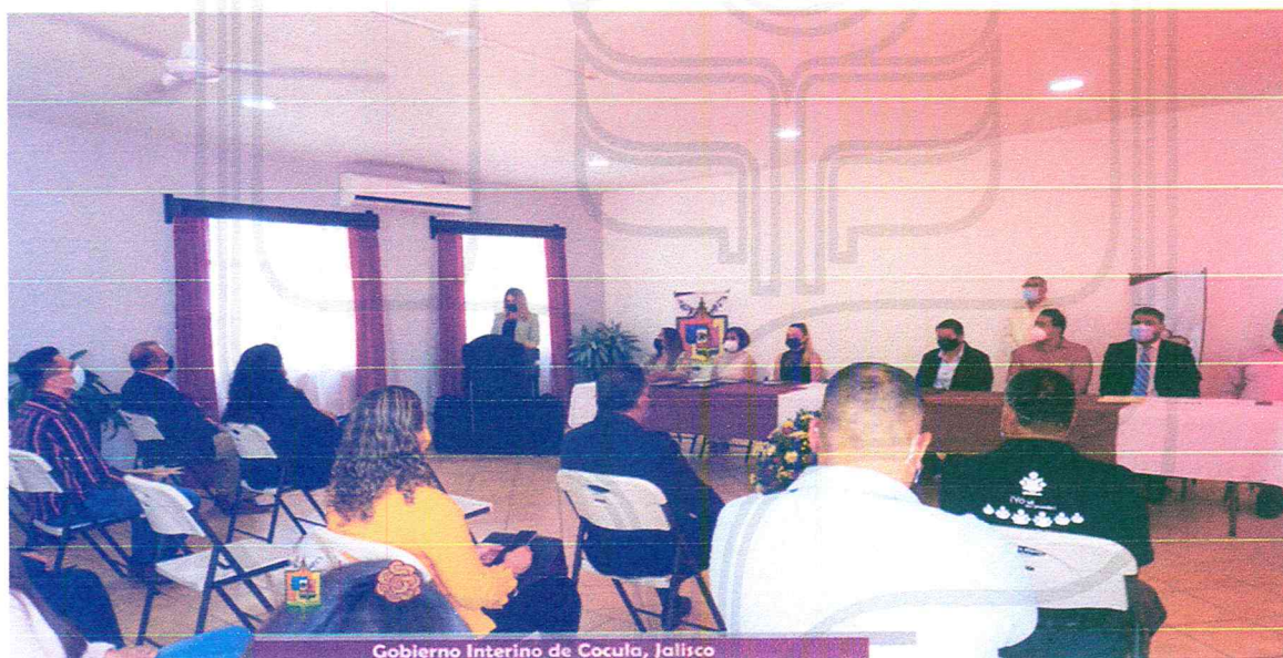
Gobierno Interino de Cocula, Jalisco

El maestro es un mediador entre el alumno y el ambiente que le rodea para que mediante su inserción en los espacios educativos trasciendan como agentes de cambio en el espacio donde se desenvuelven. "reconocer su labor es un privilegio."