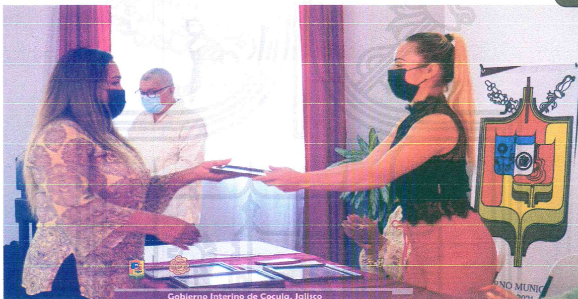
Gobierno Interino de Cocula, Jalisco