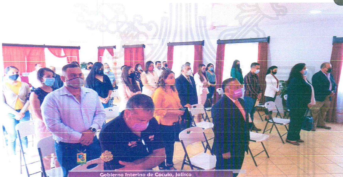
Gobierno Interino de Cocula, Jalisco