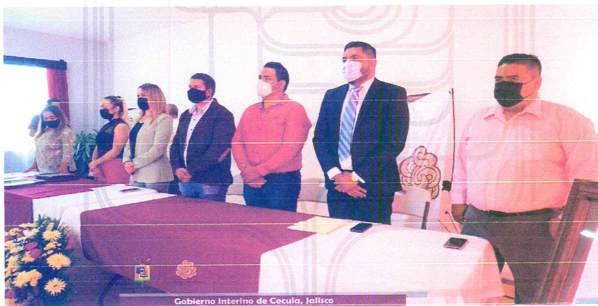
Gobierno Interino de Cocula, Jalisco