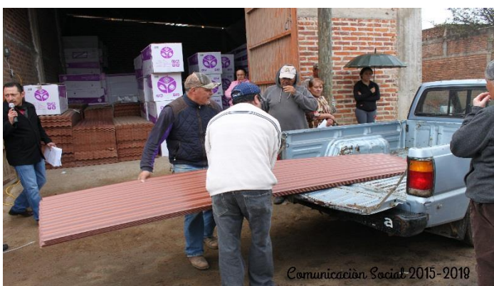
Comunicación Social 2015-2018