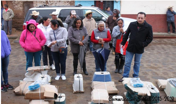
Comunicación Social 2015-2018

En Concepción de Buenos solicitaron ampliar la demanda del programa de transporte para estudiantes e incorporar el programa de apoyo en Transporte Multimodal para que más alumnos lleguen de una forma más ágil a sus centros educativos.