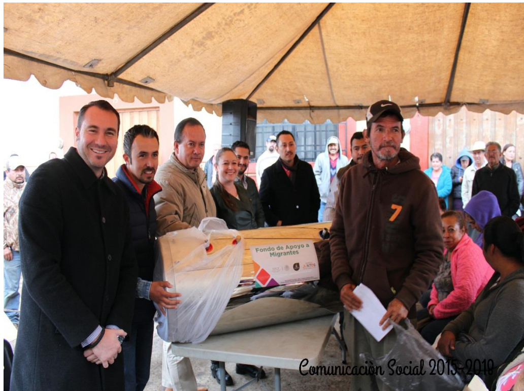
Comunicación Social 2015-2018

El FAM cuenta con dos modalidades: Mejoramiento de Vivienda y Apoyo Productivo, y el recurso va dirigido a quienes reciben remesas de familiares en Estados Unidos, pero también a quienes son migrantes en retorno y sus familias.