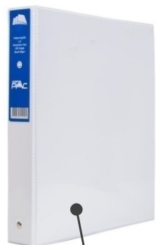
CARPETA Nombre Obra