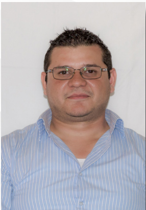
Obras Públicas Arq. Edgar Abelardo Caro Castillo