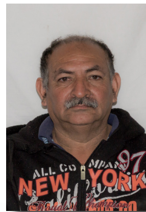
Panteón Municipal C. Jorge Robles Aréchiga