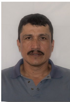
Rastro Municipal C. José de Jesús Chávez