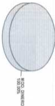
Distribución del Patrimonio