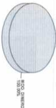
Distribución del Patrimonio