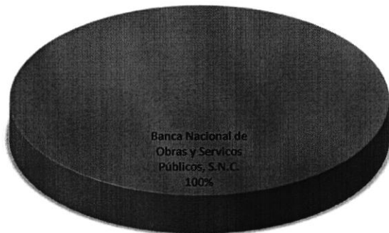
DISTRIBUCIÓN DE LA DEUDA