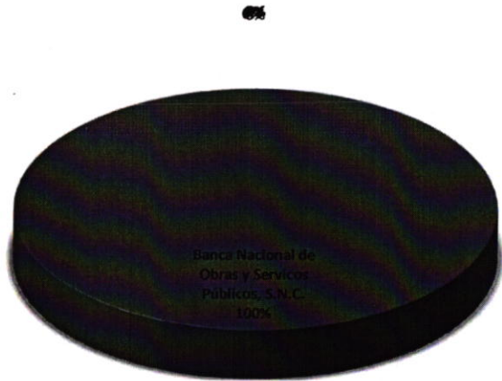
DISTRIBUCIÓN DE LA DEUDA