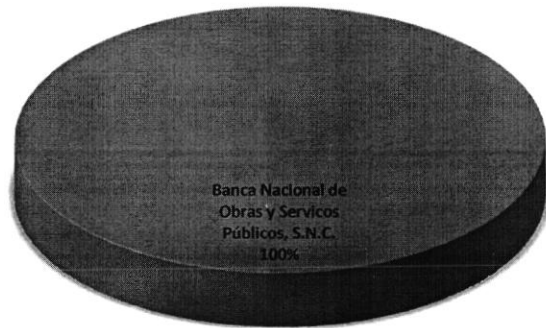
DISTRIBUCIÓN DE LA DEUDA