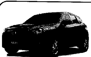
Mazda CX-5 2015

Total de comisiones cobradas en el Periodo: $273.00