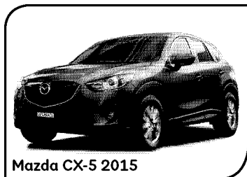
Mazda CX-5 2015

Si deseas enviar alguna correspondencia, favor de dirigirla a: Scotiabank Inverlat, S.A. Apartado Postal No. 8-814, Código Postal 15801, México, D.F.