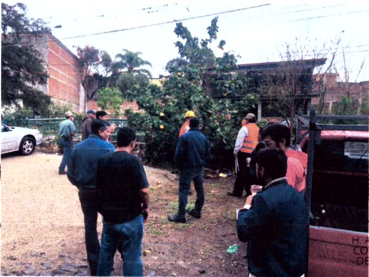
Ilustración Curso-Taller Poda y derribo en arbolado urbano impartido por FIPRODEFO.