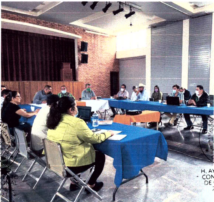
Ilustración Reuniones JIMAV. Izq. Informe de incendios forestales, temporada 2021, Tequila, Jalisco. Der. Reunión de la comisión de medio ambiente, Ahualulco De Mercado, Jalisco.