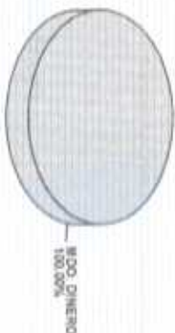
Distribución del Patrimonio