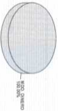
Distribución del Patrimonio