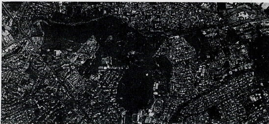
Ortófoto Zona Metropolitana de Guadalajara 2011 DEL IITEJ

Del total de la superficie del Área Natural Protegida del Bosque Los Colomos es de 90.72 has que son de propiedad de Gobierno del Estado de Jalisco, dada en comodato para su administración al Municipio de Guadalajara, de las 90.72 has. 19.443 corresponden a predios particulares y 69,817.75 m 2 (6.98 has.) al Vivero Estatal "Los Colomos" que es administrado por La Secretaria de Medio Ambiente y Desarrollo Territorial Actualmente.