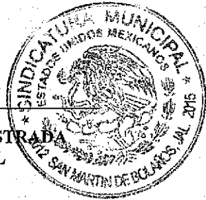
C. HORTENCIA SALAZAR ESTRADA SÍNDICO MUNICIPAL