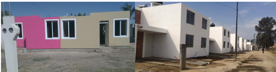
Tlajomulco de Zúñiga (Nuevo San Miguel II)

Iniciamos con el tercer trimestre : Seguimiento al proceso administrativo ante el Comité Técnico del FOEDEN por las viviendas ejecutadas para la atención de familias afectadas por contingencias en Zapotlán el Grande y Tlajomulco de Zúñiga respectivamente. Por parte de la Presidencia del Fideicomiso (SSAS) se hizo la solicitud de reintegro de los recursos al municipio de Tlajomulco y en Zapotlán el Grande se continúa el proceso de escrituración y se cuenta a la fecha con 06 de 11 escrituras de los beneficiarios; el resto se encuentran en proceso en trámite en notaría, aquí se ven algunas imágenes: