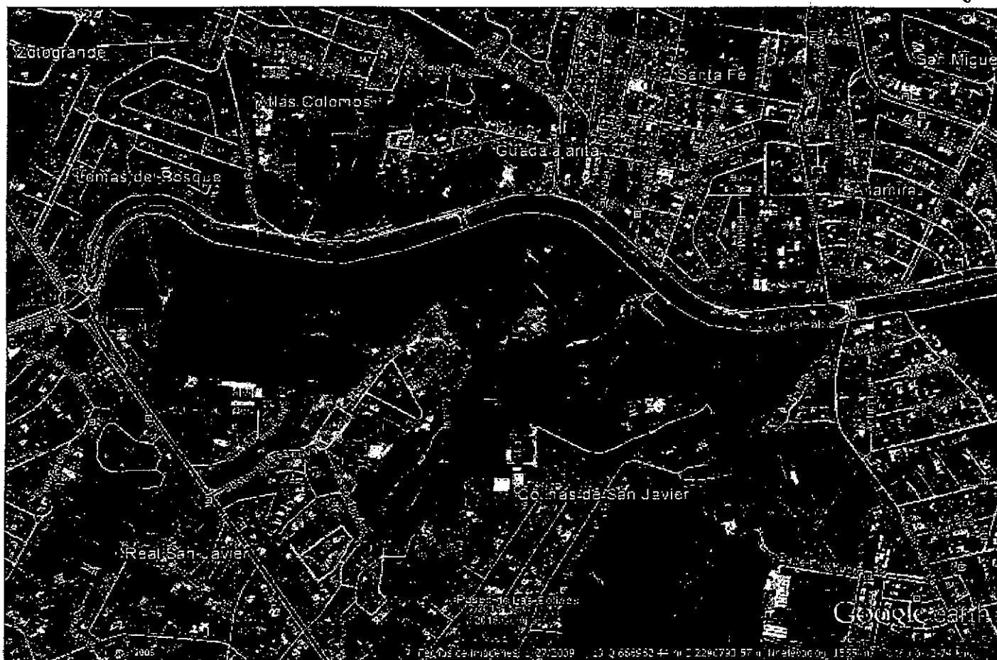
Imagen Satelital de ubicación del predio donde se ubica el Vivero Estatal los Colomos dentro del Municipio de Guadalajara, Jalisco.

Al encontrarme en el lugar de los hechos sobre la Calle Avenida Patria notándose que el número exterior es el 1000, entre la Calle Alberta (al oriente) y Bosque de los Colomos (al poniente), en el Municipio de Guadalajara, Jalisco. Tratándose de predio donde se encuentran las instalaciones del Vivero Estatal los Colomos perteneciente al Estado de Jalisco, teniendo una forma irregular y con pendiente en distintos puntos del mismo. Cuenta con instalaciones de oficinas, resguardo de plantas, criadero de avispas, áreas verdes, áreas comunes de convivencia, arroyos artificiales y canales para el paso de agua pluvial. En la extensión del terreno cuenta con algunos caminamientos realizados con troncos de árboles y caminamientos para automóviles de terracería.