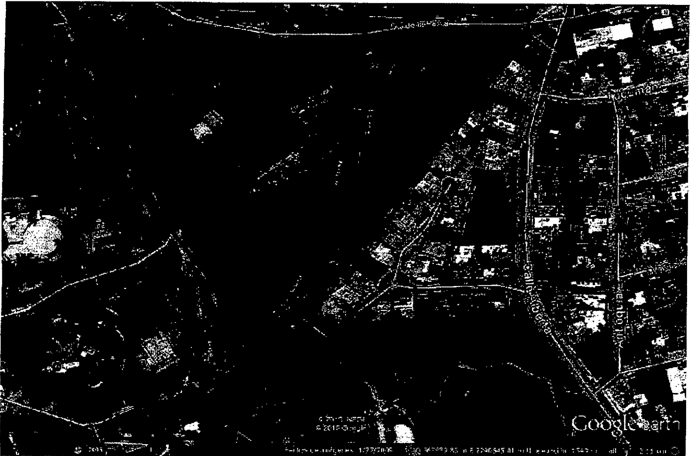
Imagen Satelital donde se muestran las medidas resultantes de los puntos satelitales que se obtuvieron en campo. Imagen obtenida de Google Earth con fecha 01/27/2009.