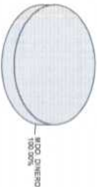
Distribución del Patrimonio