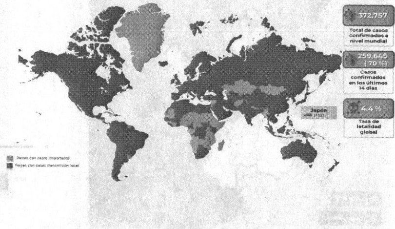
Distribución global de casos confirmados de COVID-19 por SARS-CoV-2 por laboratorio al día 24 de marzo de 2020.