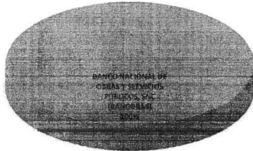
DISTRIBUCIÓN DE LA DEUDA