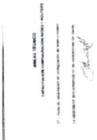
PI-42 Anexo tecnico.tif 7K