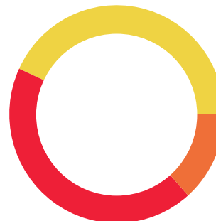
ENLACE GLOBAL PM S/INTERESES (Saldo inicial de $3,466.67)