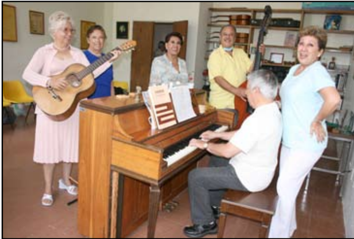
A través de una amplia variedad de actividades, nuestros Adultos Mayores estimulan su desarrollo integral en nuestros Centros de Día.