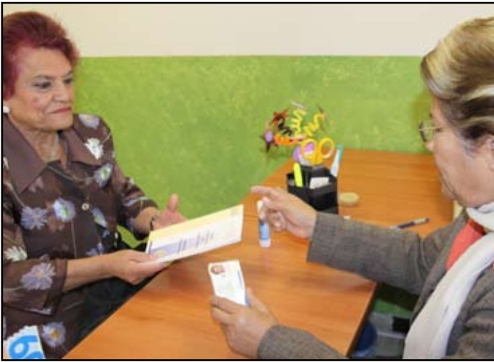
A través del programa "Plan Venerable", los adultos mayores jaliscienses acceden a una gran variedad de beneficios.

credenciales para los usuarios del resto de los municipios en oficinas centrales o en los Sistemas DIF Municipales más cercanos a su respectiva población.