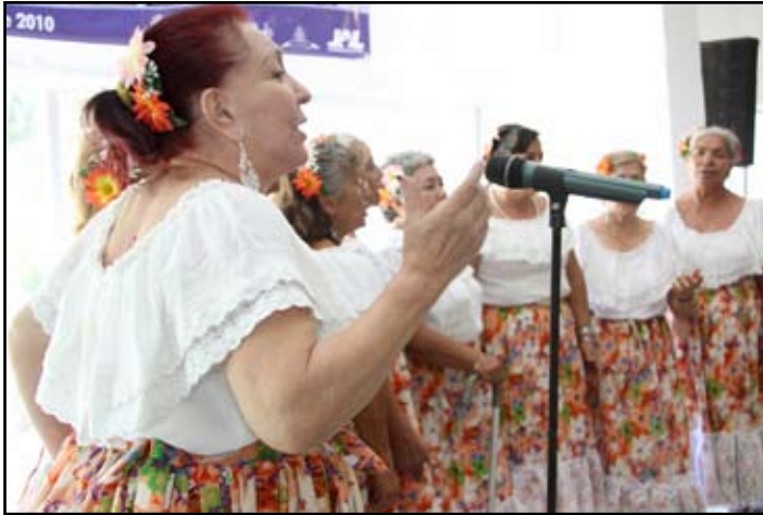
A través de los grupos comunitarios, nuestros adultos mayores se integran, aprenden y se recrean.

grupos comunitarios, compuestos por 28 mil 581 adultos mayores.