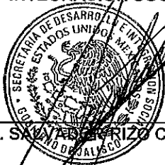
LIC. SALVADOR RIZO CASTELO

EL SECRETARIO DE DESARROLLO E INTEGRACIÓN SOCIAL