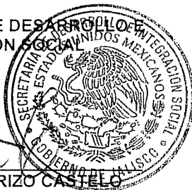
LIC. SALVADOR RIZO CASTELO

EL SECRETARIO DE DESARROLLO SOCIAL INTEGRACIÓN SOCIAL