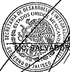
MTRO. SALVADOR RIZO CASTELO

EL SECRETARIO DE DESARROLLO E INTEGRACIÓN SOCIAL