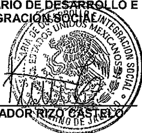
LIC. SALVADOR RIZO CASTEL

EL SECRETARIO DE DESARROLLO E INTEGRACIÓN SOCIAL