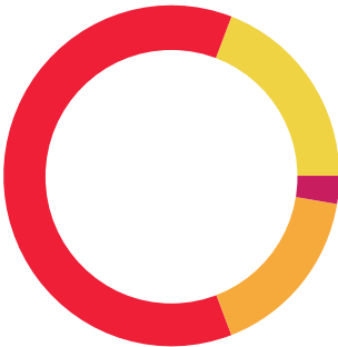
ENLACE GLOBAL PM S/INTERESES (Saldo inicial de $548.60)