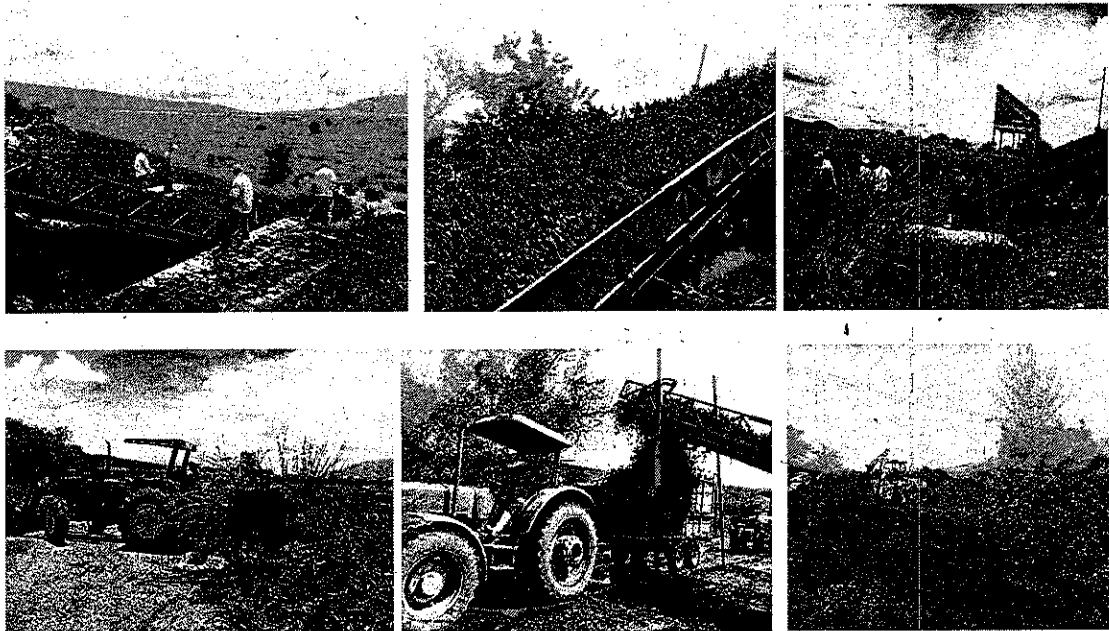
Actividades de extracción de lirio acuático, en la Laguna de Zapotlán.

Para realizar las actividades de extracción, manejo y disposición final de lirio acuático en la Laguna de Zapotlán, actualmente se cuenta con 2 bandas cosechadoras, ubicadas estratégicamente en el sector norte y noreste de la laguna respectivamente. Con el apoyo de las brigadas de pescadores se realizan las actividades acarreo y carga del lirio hacia las bandas cosechadoras. Posteriormente el lirio se deposita en remolques de 7 m 3 de capacidad y es trasladado con el apoyo de 2 tractores hacia los patios de disposición temporal, los cuales están ubicados en áreas cercanas a las bandas cosechadoras. El propósito de establecer estos sitios temporales, es con la finalidad de que las plantas vayan perdiendo humedad, para su posterior envío a disposición final.