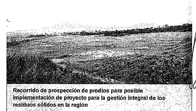
Recorrido de prospección de predios para posible implementación de proyecto para la gestión integral de los residuos sólidos en la región