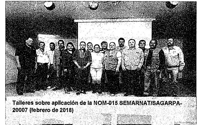
Talleres sobre aplicación de la NOM-015 SEMARNAT/SAGARPA-2007 (febrero de 2018)