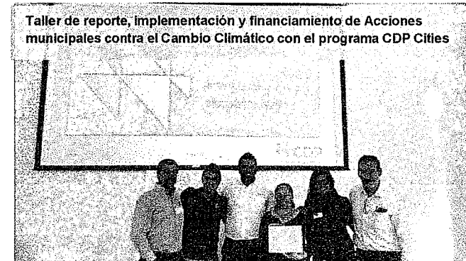
Taller de reporte, implementación y financiamiento de Acciones municipales contra el Cambio Climático con el programa CDP Cities