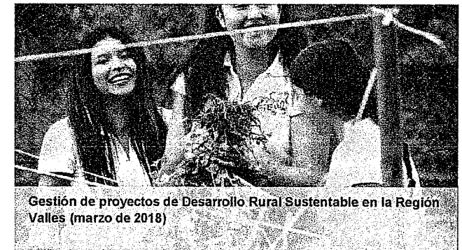
Gestión de proyectos de Desarrollo Rural Sustentable en la Región Valles (marzo de 2018)