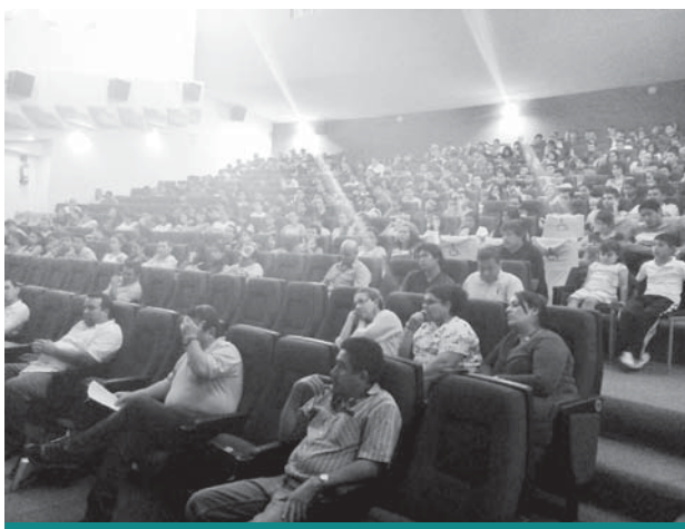
Centro Universitario Ameca