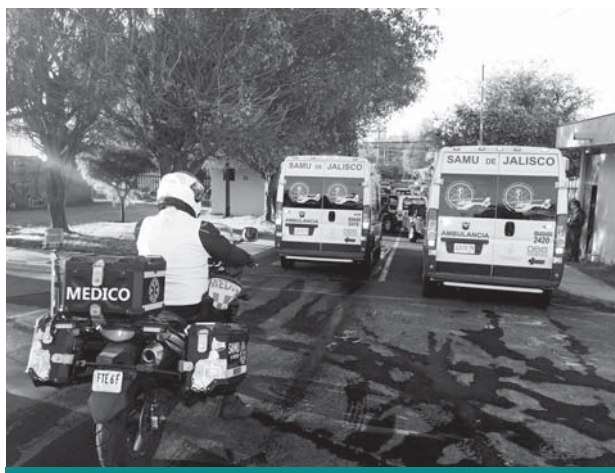
Calles del Área Metropolitana de Guadalajara