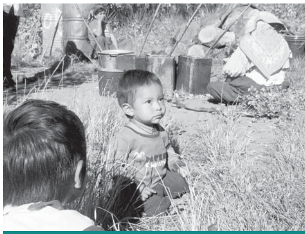
Población wixárika, Colotlán