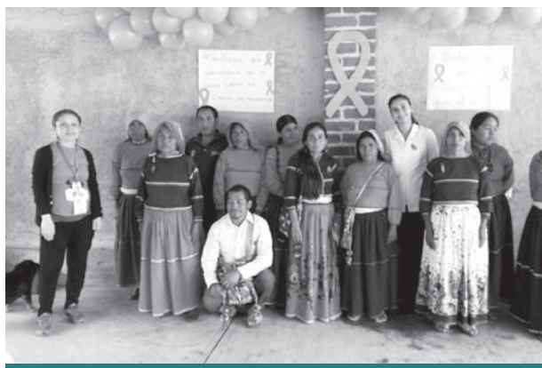
Comunidad wixárika de la Región Sanitaria I Colotlán

El Coesida organizó la capacitación de 2,498 personas que ocupan sitios clave en la atención y educación de la población jalisciense, tanto del sector salud como de universidades públicas y privadas.