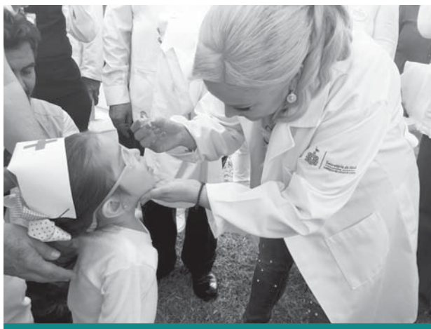
Hospital Regional, Puerto Vallarta