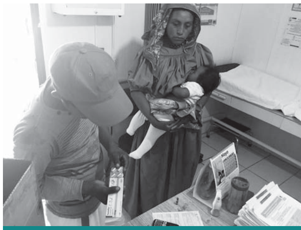
Comunidad wixárika, Sierra de Ocota, Colotlán