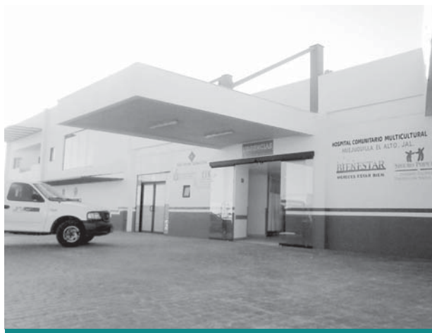
Huejuquilla el Alto