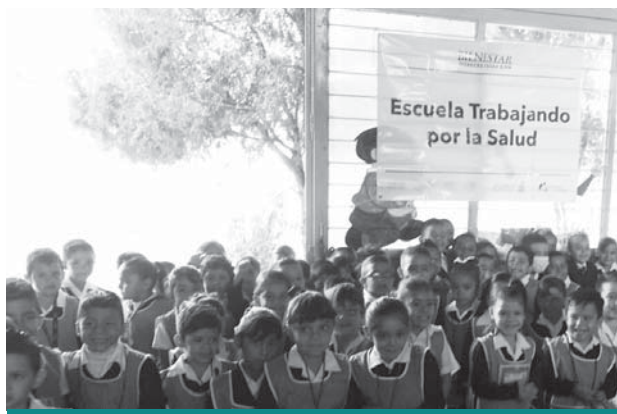
Balcones de Oblatos, Guadalajara