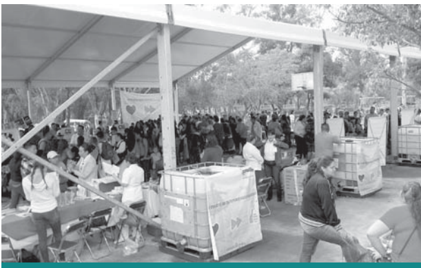
Parque Solidaridad, Guadalajara