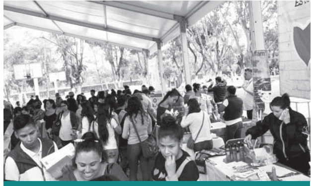
Parque Solidaridad, Guadalajara