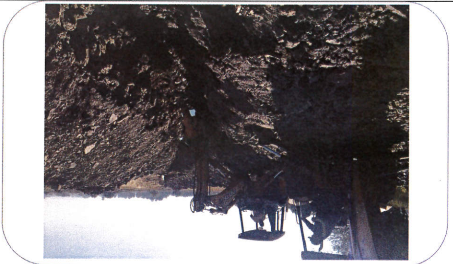
FOTOGRAFÍAS DE LA OBRA