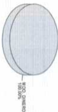
Distribución del Patrimonio