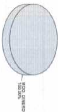
Distribución del Patrimonio