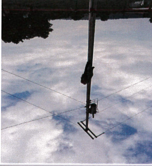
FOTOGRAFÍAS DE LA OBRA