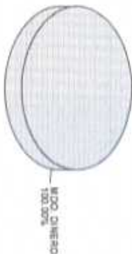
Distribución del Patrimonio